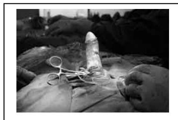
b. Sau phẫu thuật