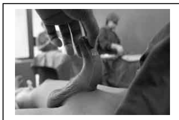
a. Trước phẫu thuật